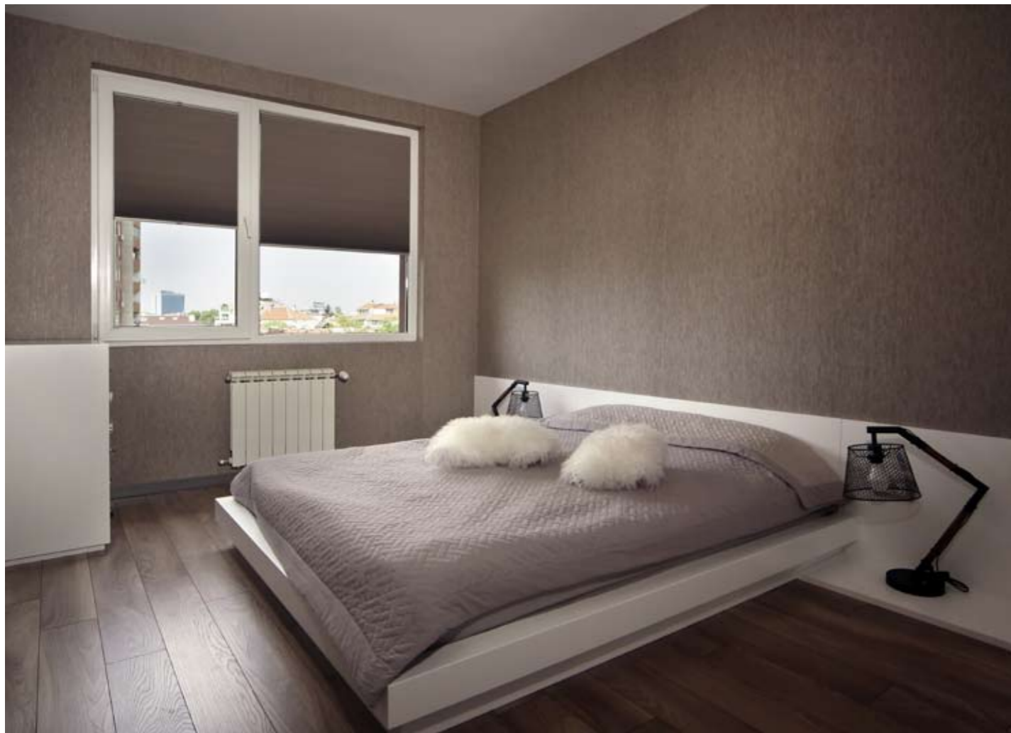
Основната спалня – осветление и обзавеждане от АТГ.

плота в кухнята, която пък е изцяло в бяло.