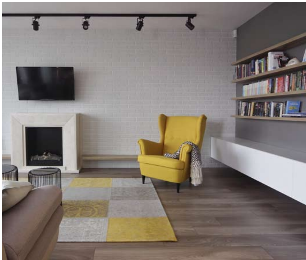
В къта срещу камината – диван, фотьойл на ИКЕА и килим от „Карпет макс“.