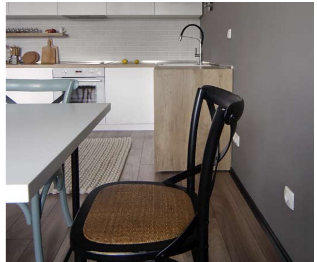
Трапезарията и кухнята. Кухнята е изработена по детайл от българска фирма.